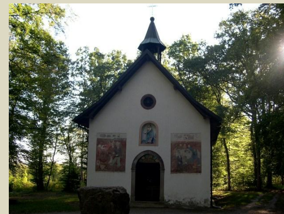
Chapelle Notre Dame des Bouleaux (GUEWENHEIM)